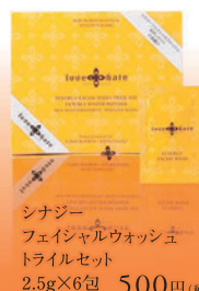
シナジーフェイスルウォッシュ トライルセット 2.5g×6包 500円(税込)