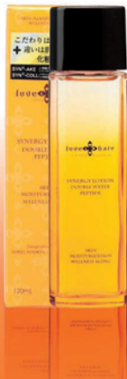
シナジーローション 120ml 4,500円(税込)