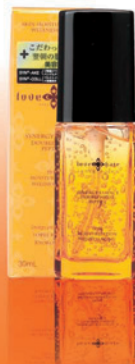
シナジーエッセンス 30ml 5,800円(税込)