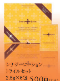
シナジーローション トライルセット 2.5g×6包 500円(税込)