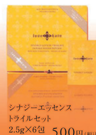
シナジーエッセンス トライルセット 2.5g×6包 500円(税込)