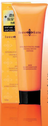
シナジーフェイスルウォッシュ 120g 2,500円(税込)